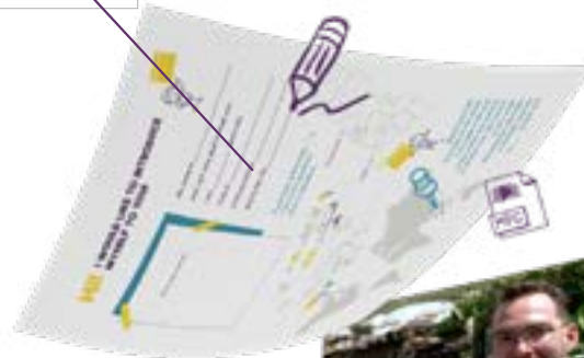
Interactieve 3-delige video die je als geheel of in losse delen kunt afspelen