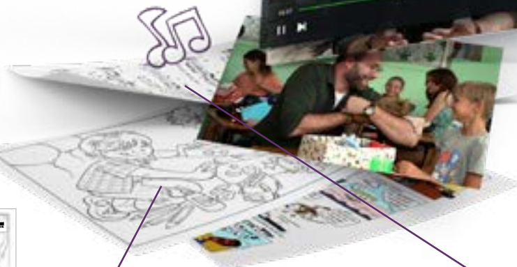
leurplaten en strip